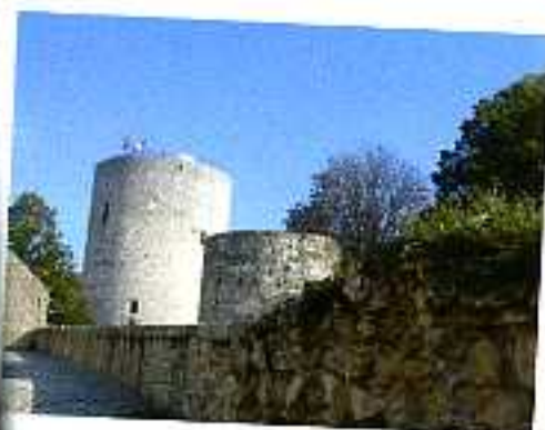
Deux villes royales...