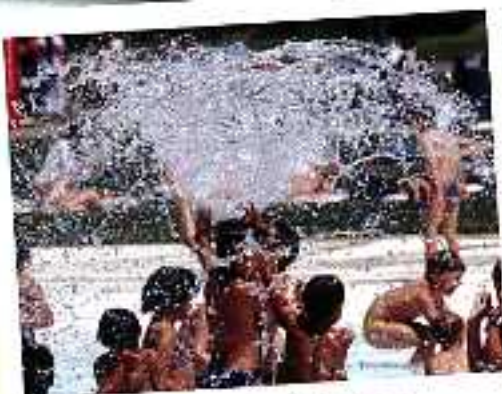
Des sites de loisirs actifs...