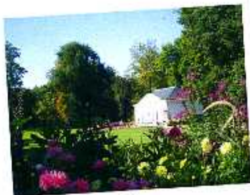
Des jardins exceptionnels...