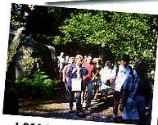
1 800 km de chemins de randonnée...