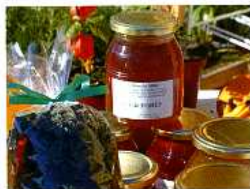
Des producteurs du terroir.