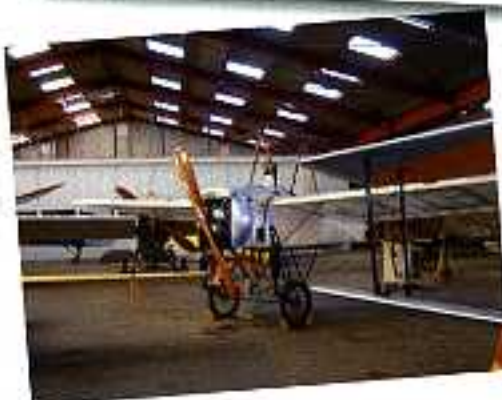
Une terre d'aviation...