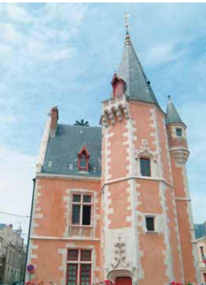
Hôtel de Ville d'Etampes