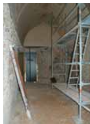
Salle du Châtelet (fin juillet 2009)

La ville de Dourdan a souhaité améliorer l'accueil de son musée en attendant le lancement de travaux d'agrandissement plus conséquents envisagés à moyen terme. Dans les locaux actuels, il s'agit de créer d'ici décembre 2009 un nouvel espace d'accueil, de mettre aux normes les installations électriques et de chauffage, de sécuriser le musée et d'améliorer le confort de visite (éclairage, peintures, ...).