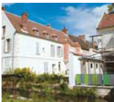
Maison Cocteau et pavillon d'accueil (juillet 2009)