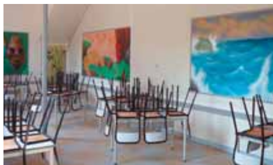
Salle de restaurant actuelle