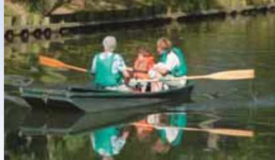
Promenade en barque

lisée en 2008 par le cabinet-conseil DMC Consultant a positionné la Propriété Caillebotte comme l'un des jardins majeurs du département et préconise une réflexion globale sur le développement touristique à l'échelle de ce site. Le Parc Caillebotte propose au public : des espaces d'expositions temporaires (ferme ornée et orangerie), un restaurant gastronomique (chalet du Parc), un espace d'exposition de reproductions d'œuvres de Caillebotte (Casin), des fabriques rénovées (kiosque et glacière) et un potager.