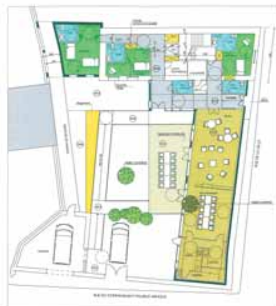
Projet : rez-de-chaussée

« tourisme et handicap ». Surface totale : 293 m 2 , surface du terrain : environ 300 m 2 , extension : 140 m 2 . Le projet retenu prévoit la réhabilitation complète du bâtiment actuel totalement consacré à l'hébergement. Il offrira une capacité de 7 lits dans 6 chambres accessibles aux personnes handicapées (création d'un ascenseur et d'un nouvel escalier) et de 4 lits dans deux chambres réservées aux accompagnateurs. Les pièces à vivre en rez-de-chaussée (salon, salle à manger, cuisine de type familial) sont créées sur une extension totalement accessible. Une place de parking handicapée est créée ainsi que le cheminement adapté jusqu'au bâtiment.