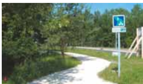
Le chemin Gâtinais Beauce