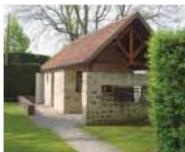
Espace d'accueil actuel

Le projet consiste à agrandir le local d'accueil actuel afin de proposer au public une vraie boutique et des sanitaires. Des places de parking seront également aménagées à côté. La bande son sera numérisée et diffusée par un lecteur numérique et un système de sécurité 24h/24h sera installé. Les travaux doivent débuter fin 2009 et s'achever au printemps 2010.