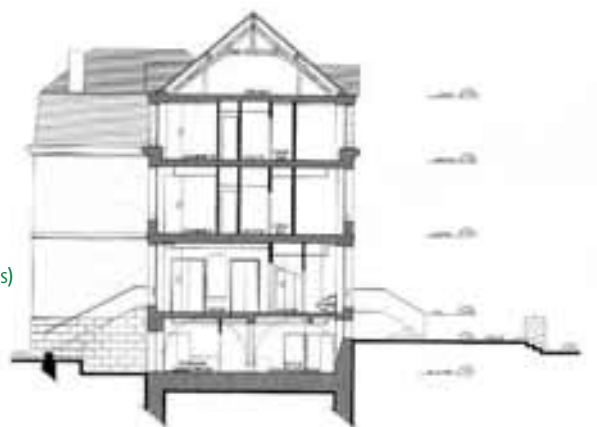
Vue en coupe

La commune de Gironville-sur-Essonne a acheté un château du XIX ème siècle en 1995, situé en centre-bourg, en face de l'église. Des travaux de rénovation des façades et des fenêtres ont été engagés et sont achevés. Le projet consiste à proposer un hébergement de qualité adapté à l'accueil de groupes et d'individuels, de 60 lits, à la nuitée ou en séjour. Le plan de financement définitif a été acté en décembre 2006, le permis de construire a été acquis en novembre 2007. L'année 2008 a été consacrée à la sélection d'un délégataire dans le cadre d'une Délégation de Service Public, qui s'appelle ODCVL. Les travaux sont prévus de fin-2009 à mi-2011 avec une ouverture au public en juillet 2011. Le montage définitif du projet (plan et financement) est en cours (fin prévue en octobre 2009).