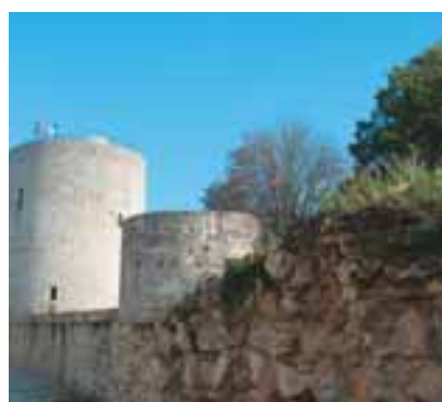
Vue sur le donjon