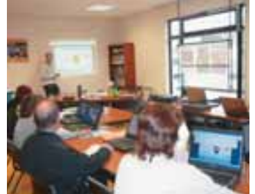
Session de février 2008

Cet atelier, destiné à 8 personnes maximum , sera animé par un formateur professionnel. Les frais de participation s'élèvent à 100€ par personne pour les 2 jours. Si vous souhaitez suivre cette formation, contactez Stéphane BIENVAULT Tél 01 64 97 96 33 au plus tard le 30/10/09.