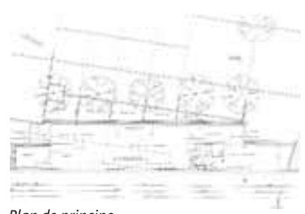
Plan de principe

Contact : M. DUBOIS, 1 er Maire -adjoint, tél 01 64 95 00 20, www.commune-de-mereville.com