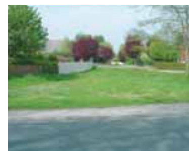
Parking à venir

COÛT TOTAL PRÉVU DES TRAVAUX : 240.000 EUROS HT