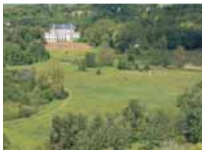
Vue depuis la Tour Trajane

Les Projets touristiques de nos partenaires