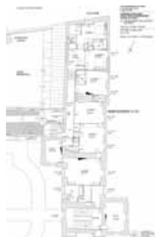
Plan du 1 er étage des communs (12 chambres)