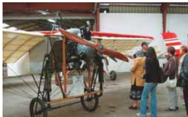
Le musée "volant"