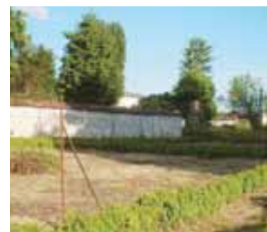
Le jardin (juin 2009)

La Maison de Jean Cocteau à Milly-la-Forêt a été achetée en 2002 par l'association « Maison Jean Cocteau à Milly-la-Forêt » avec la participation de M. Pierre Bergé (213.500 €), de la Région Ile-de-France et du Département de l'Essonne (427.000 € pour chacune des deux collectivités territoriales).