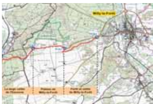
Plan de Milly la Forêt à Maise

Contact : Conseil général de l'Essonne, Mme Leslie MONTELLY, tél 01 60 91 96 37, www.cg91.fr