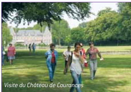
Visite du Château de Courances

CONTACT : Marianick Bourdais 01 64 97 36 90 - mbourdais@cdt91.com