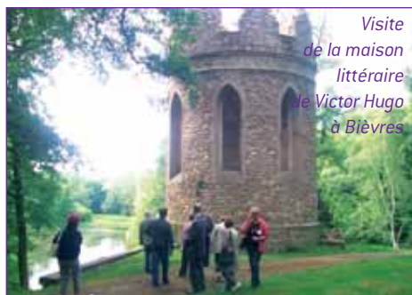
Visite de la maison littéraire de Victor Hugo à Bièvres

Durant les mois d'avril et mai ont eu lieu des journées de formation du CDT à destination des offices de tourisme et syndicats d'initiative de l'Essonne : deux journées de découverte des sites touristiques du département : parc de Courances,